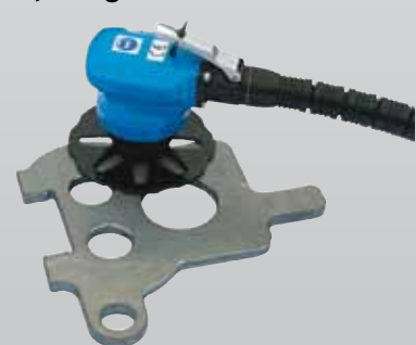
Bestell-Nr. 310-DHKKF Preis €* 764,-