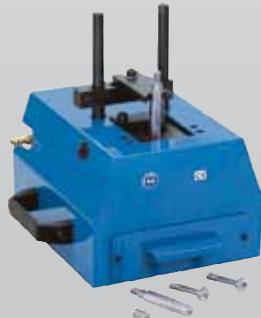
Bestell-Nr. DR 426 Preis €* 1658,-