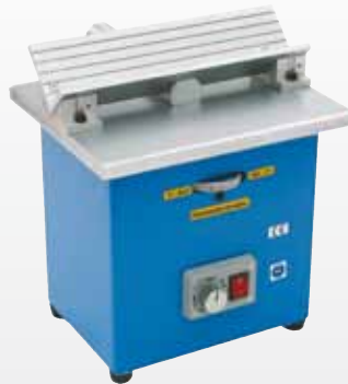
Best.-Nr. 00645-KKE2 1585,- €*