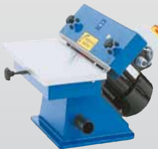
Bestell-Nr. 16545-KE1 Preis €* 1215,-