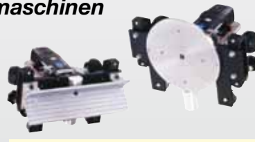
Bestell-Nr. 320-HKK 1238,- €* 200-HKK1 (Tischplatte) 958,- €* 300-HKE1 (Prisma) 998,- €*