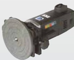
Bestell-Nr. HKKF-125 Preis €* 517,-