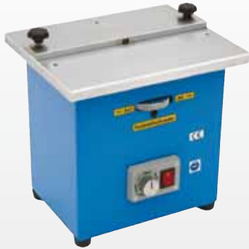
Best.-Nr. 00645-KKE1 1280,- €*