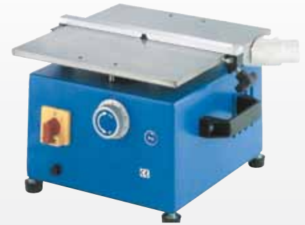
Bestell-Nr. U.06845 2222,- €* U.06845P (mit Prisma) 2475,- €*