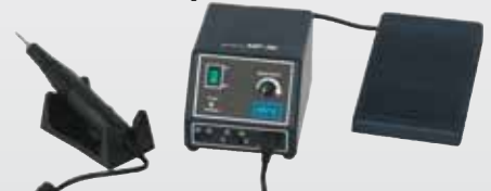
Bestell-Nr. MP35 (35000U/min.) 658,- €* Bestell-Nr. MP55 (55000U/min.) 931,- €*