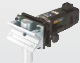
Bestell-Nr. HKF-120 Preis €* 517,-