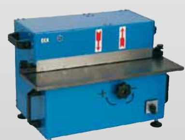
Best.-Nr. BKE-550 2365,- €*